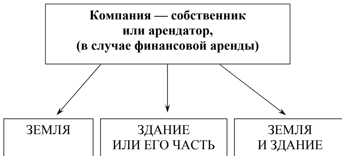
Рис. 2. Состав инвестиционной недвижимости

в аренду, или увеличения его стоимости (роста капитальной ценности), или того или другого вместе (рис. 2). Оно не используется в процессе производства продукции или продажи товаров и услуг, для административных целей или продажи в процессе обычной хозяйственной деятельности. Компания — собственник или арендатор (в случае финансовой аренды) может инвестировать деньги в недвижимое имущество с целью сдачи в аренду; увеличения стоимости имущества в результате определенных условий; того и другого вместе.